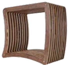
gerade aufsteigende Seite fördert aufrechtes Sitzen