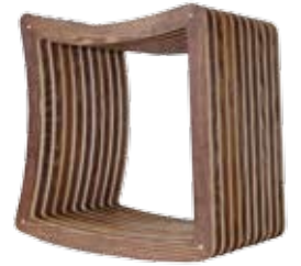
konkave Seite ermöglicht angenehmes Schaukeln