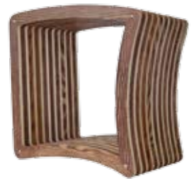
konvexe Seite fördert aufrechtes Sitzen