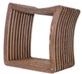
mittig konkave Seite sesselähnliches Sitzen